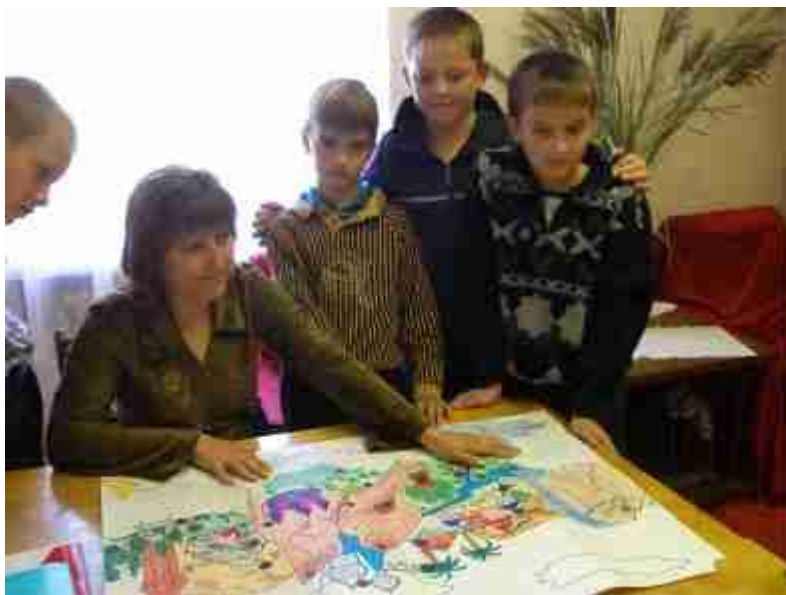
Фото 8. Педагог-психолог беседует с подростками

Желание общаться в кругу сверстников – характерная особенность представителей молодого поколения. По данным опросов наиболее популярным способом свободного времяпровождения среди наших подростков являются встречи с друзьями (83%). В период каникул педагоги совместно с педагогом-психологом специально организуют социальные гостиные, группы общения.