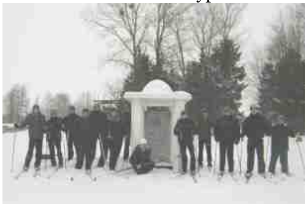
Фото 11. Участники «Звездного похода» у памятника «жертвам фашизма» близ г.п.Радунь

Одно из наиболее ярких массовых спортивно-туристических мероприятий, организуемых клубом «Робинзон» – традиционный лыжный «Звездный поход» в честь Дня Защитника Отечества. Мероприятие не только сочетает туризм и спорт, но и имеет большой воспитательный потенциал. В программу включены преодоление препятствий на лыжных маршрутах, встречи с ветеранами войны, посещение военно-патриотических музеев школ района, туристско-спортивные соревнования и многочисленные конкурсы.