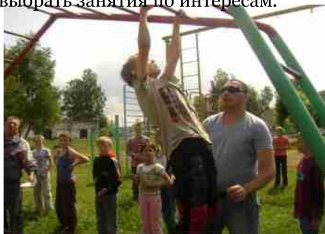
Фото 2. Девочки высаживают цветы. Мальчики занимаются на спортивной площадке

Планируя работу в лагере, мы предоставляем ребятам время и для пассивного отдыха: просмотра газет, настольных игр, непринужденной беседы, обмена мнениями, прогулки наедине с собой. Отдых такого рода индивидуален и является позитивным.