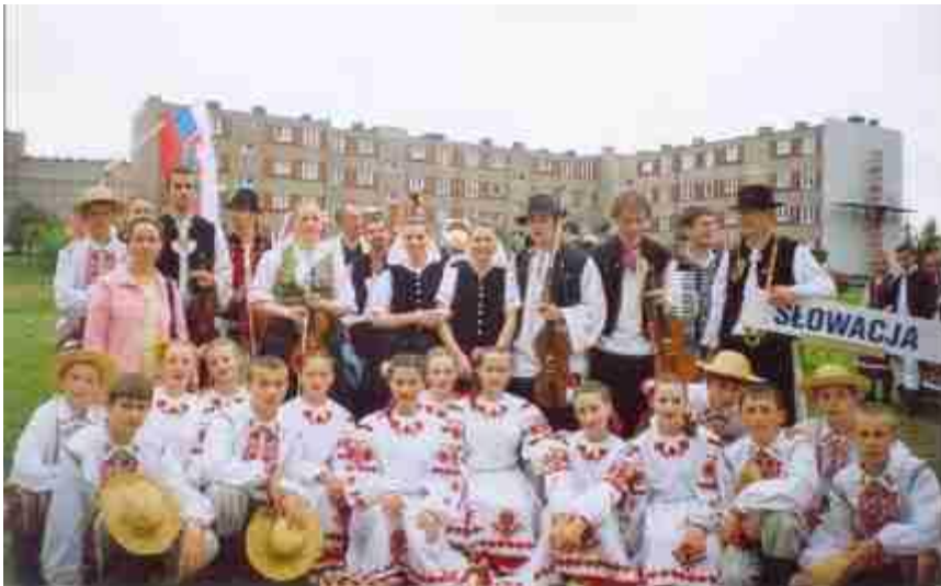
Фото 5. Участники ансамбля «Радунские словики» на международном фестивале в г.Варшава, РП.

У нас есть и своя знаменитость – наша гордость – ансамбль песни и танца «Радунские словики» , лауреат и дипломант областных, международных смотров, конкурсов и фестивалей, проходивших в городах нашей республики, а так же в Польше и Литве. Ансамбль – постоянный участник районных мероприятий и концертов. В нем занимается более 60 ребят от 6 до 17 лет. Весь коллектив – как дружная семья. Участники ансамбля «Радунские словики» были героями республиканской телевизионной программы «Пой душа».