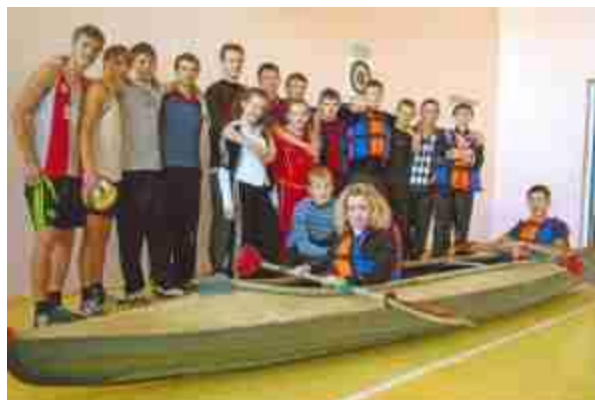
Фото 13. Команда туристов-водников – лучшая в области

Мы уверены, туристско-краеведческая деятельность – одно из наиболее эффективных средств воспитания и обучения детей и подростков, так как позволяет в комплексе решать сложнейшие воспитательные задачи.