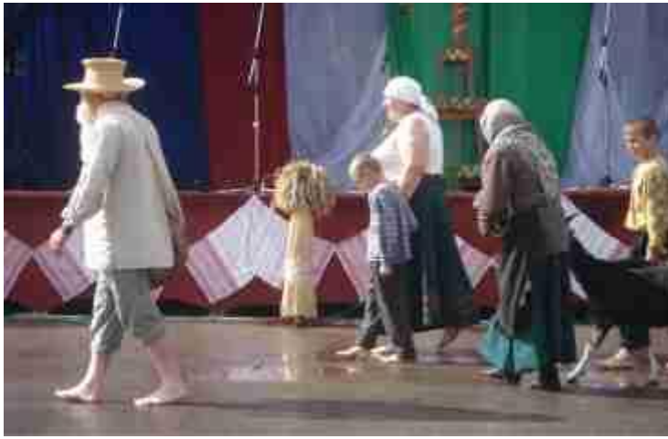
Фото 4. Общегородской праздник, посвященный 620-летию г.п.Радунь

У нас есть и своя знаменитость – наша гордость – ансамбль песни и танца «Радунские словики» , лауреат и дипломант областных, международных смотров, конкурсов и фестивалей, проходивших в городах нашей республики, а так же в Польше и Литве. Ансамбль – постоянный участник районных мероприятий и концертов. В нем занимается более 60 ребят от 6 до 17 лет. Весь коллектив – как дружная семья. Участники ансамбля «Радунские словики» были героями республиканской телевизионной программы «Пой душа».