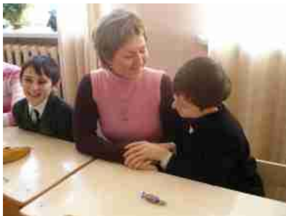
Фото 7. На заседании семейного клуба «Глаза в глаза»

Тематика заседаний клуба самая разнообразная, но она интересна представителям всех поколений, всем членам нашего большого и дружного коллектива. Именно на таких праздниках дети получают первые уроки патриотизма, т.к. для маленького гражданина любовь к Родине начинается с любви к своей семье и, в первую очередь, к самому близкому ему человеку – к маме.