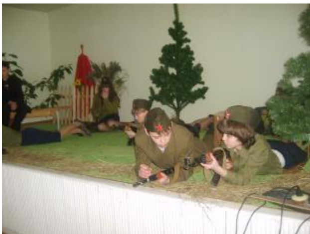
Фото 6. Фрагмент спектакля «А зори здесь тихие». Театральная студия «Ровесники»

Победители конкурса организуют шефские концерты на предприятиях и организациях г.п. Радунь, в СПК района. На заработанные деньги приобретаются сценические костюмы.