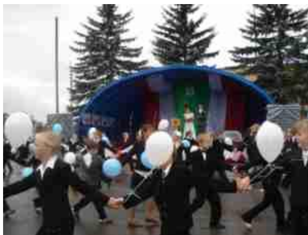
Фото 3. Общегородской праздник «Пусть будут счастливы все дети», посвященный Дню защиты детей.

В последнее время мы все чаще выходим за пределы здания школы или ГДК и обрядовые мероприятия («Купалле», «Масленица», «Покровы», Проводы зимы, Рождественская елка) проводим на открытых площадках: на стадионе, на берегу реки, на центральной площади поселка. Фольклор, традиции, обычаи, обряды – это родник, вечный источник, из которого черпаем мы силы, сверяем свою самобытность, национальные особенности.