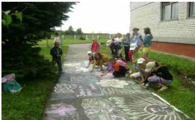
Фото 1. В пришкольном лагере проходит конкурс рисунков на асфальте «Как прекрасен этот мир»

В лагере подростку предоставляется возможность попробовать свои силы в рамках деятельности, которая ему интересна. Любят ребята организовывать игровые, конкурсные программы – пожалуйста, «Ура каникулы!». Для них же в летний период работают и кружки. Здесь каждый имеет возможность выбрать занятия по интересам.