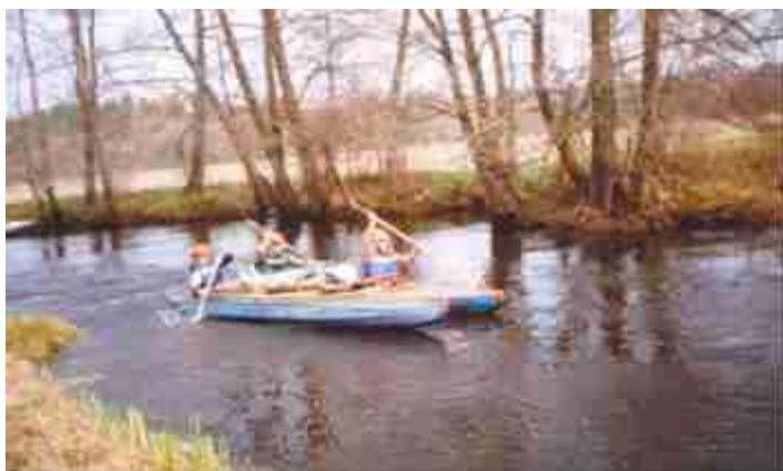
Фото 12. Слав по реке Котра на туристических байдарках

Особой популярностью среди наших учащихся пользуется водный туризм. Ежегодно на берегу озера в д.Нача организовывается работа туристского палаточного лагеря. Здесь ребята совершают водные походы, приобретают туристические навыки. При подготовке водных походов руководители и ребята не забывают о технике безопасности.