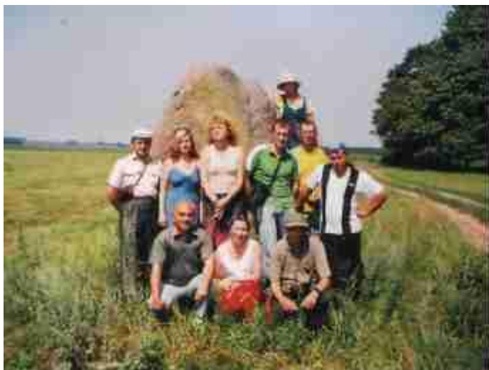
Фото 9. Участники экспедиции у культового камня в окрестностях д.Плики

Во время одной из археологических экспедиций в районе д.Тавкини ученики гимназии нашли ряд культовых камней. В окрестностях д.Плики был найден древний языческий стод (культовое божество балтского населения). Члены экспедиции – сотрудники Института истории АН Беларуси (руководитель Л.В.Дучиц) – провели дополнительные исследования вышеуказанных достопримечательностей, и внесли их в охранный каталог Республики Беларусь как уникальные культовые памятники.