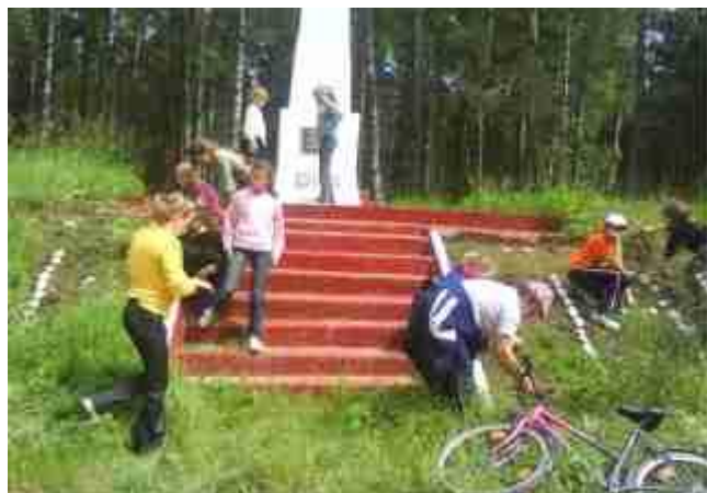
Фото 10. Участники велопохода благоустраивают памятник погибшим солдатам возле деревни Дубинцы

Во время походов ребята благоустраивают памятники воинской славы, одиночные и массовые захоронения времен первой и второй мировой войны, другие мемориальные места.